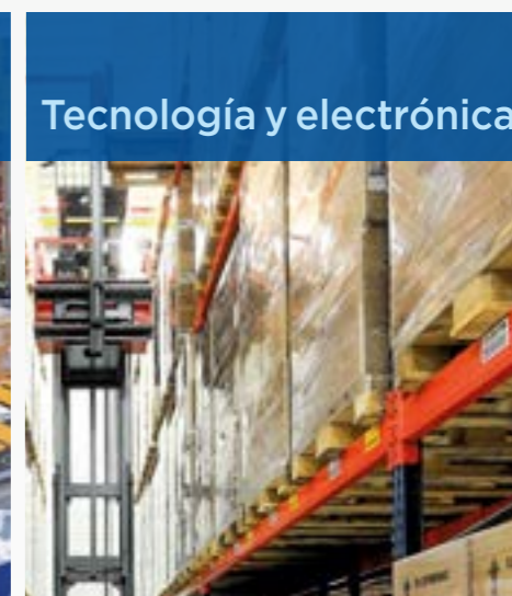
Tecnología y electrónica

Conozca nuestros casos prácticos en mecalux.com.uy